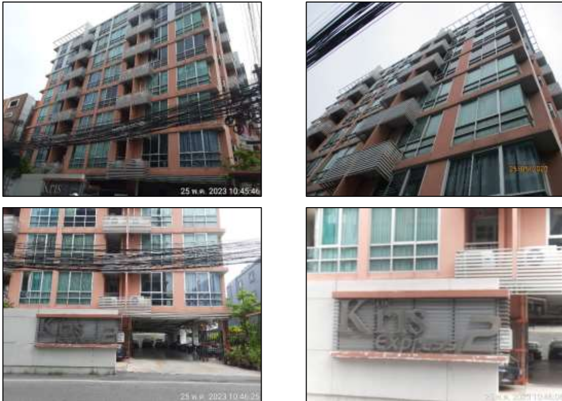
รูปที่ 1-3 สภาพปัจจุบันของโครงการ

ปัจจุบันโครงการอยู่ในช่วงเปิดดำเนินการ โดยโครงการได้รับใบรับรองการก่อสร้างอาคาร ดัดแปลงอาคาร หรือเคลื่อนย้ายอาคาร (อ.6) เรียบร้อยแล้ว ดังแสดงในภาคผนวก ก-3 และแสดง ในรูปที่ 1-3