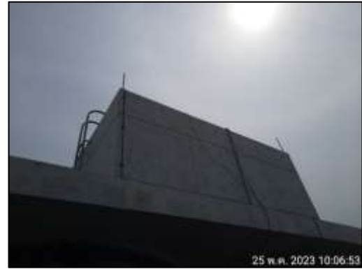
รูปที่ 1-4 ถังเก็บน้ำสำรองของโครงการ

5) ระบบจ่ายน้ำสำหรับระบบจ่ายน้ำของโครงการแบ่งเป็น 2 ระบบ คือ ระบบจ่ายโดยอาศัยแรงโน้มถ่วงของโลก และระบบปั้มน้ำ ดังแสดงในรูปที่ 1-5 โดยมีรายละเอียดดังต่อไปนี้