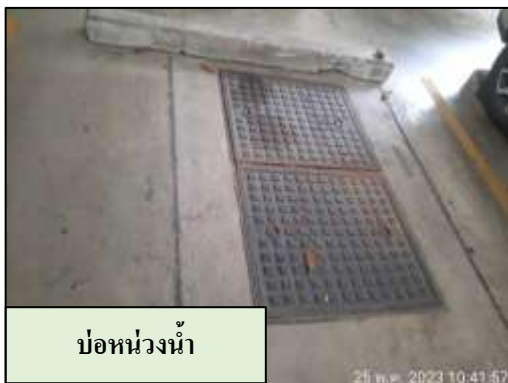
บ่อหน่วงน้ำ