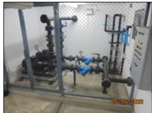
รูปที่ 1-5 ระบบปั้มน้ำของโครงการ