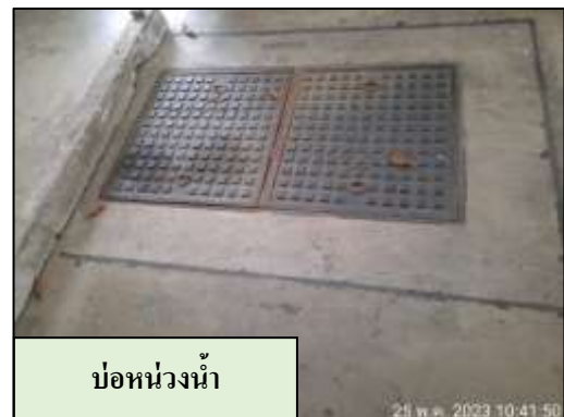
บ่อหน่วงน้ำ