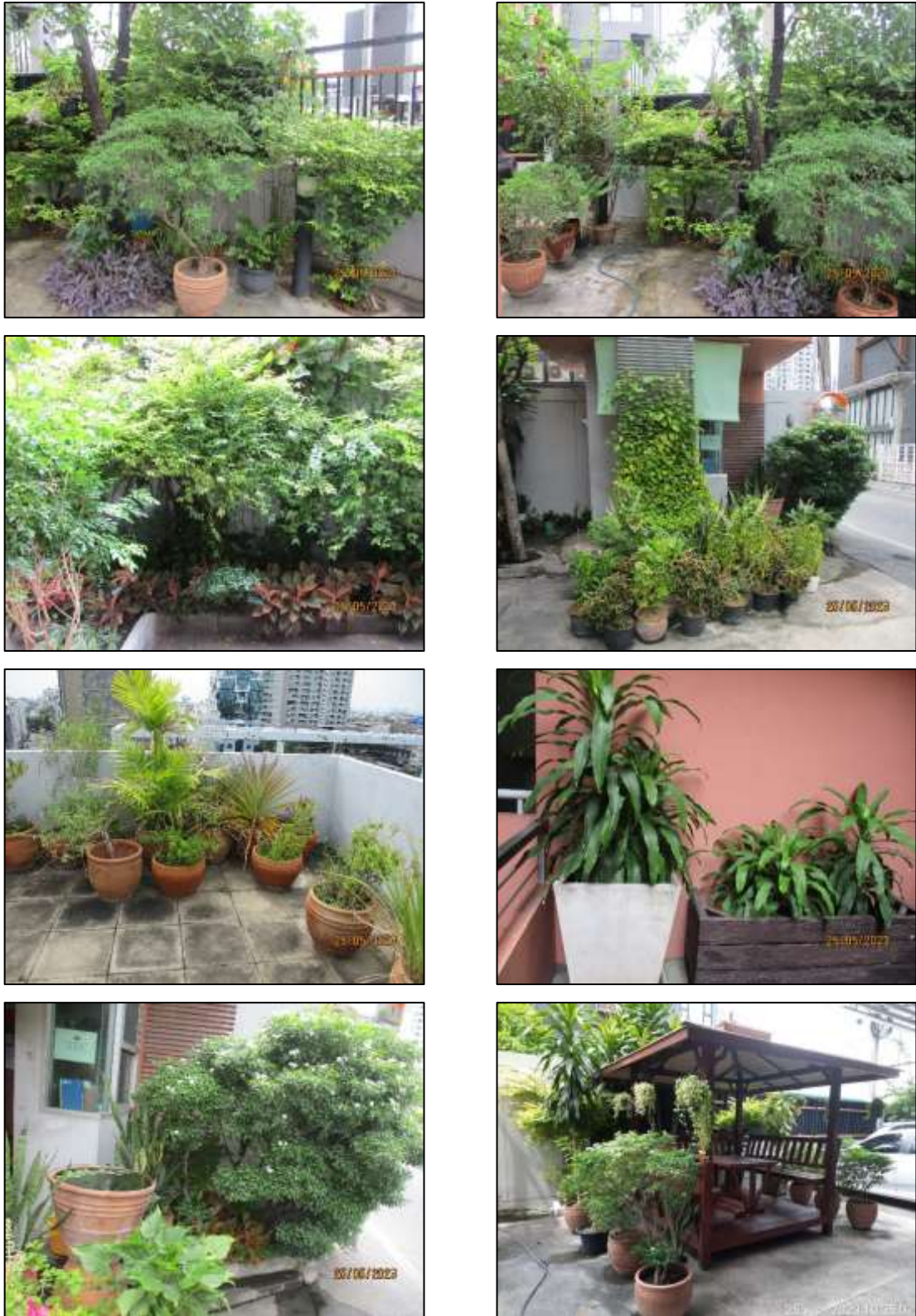
รูปที่ 1-2 พื้นที่สีเขียว และพื้นที่นันทนาการของโครงการ