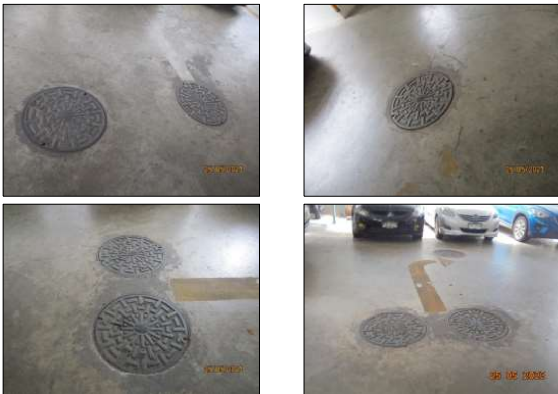
รูปที่ 1-6 ระบบบำบัดน้ำเสียสำเร็จรูป

การกำจัดกากตะกอนจากระบบบำบัดน้ำเสียสำเร็จรูป ทางโครงการจะประสานงานกับสำนักงานเขตดินแดง หรือบริษัทเอกชนที่ได้รับอนุญาตจากหน่วยงานราชการเข้ามาสูบกากตะกอนไปกำจัดต่อไป ระบบบำบัดน้ำเสียของโครงการทั้ง 4 ชุด ซึ่งเป็นระบบบำบัดน้ำเสียในปริมาณที่น้อยมาก ตะกอนที่เกิดขึ้นจึงมีน้อย ดังนั้น โครงการจะทำการสูบกากตะกอนจากระบบบำบัดน้ำเสียของโครงการทั้ง 4 ชุด ไปกำจัดประมาณปีละ 1 ครั้ง